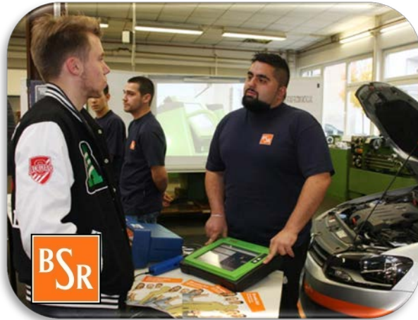
Azubis der BSR stellen im Rahmen einer Infoveranstaltung ihre Projekte vor

Impressionen der Infoveranstaltungen in der 11. Projektphase 2014/2015: