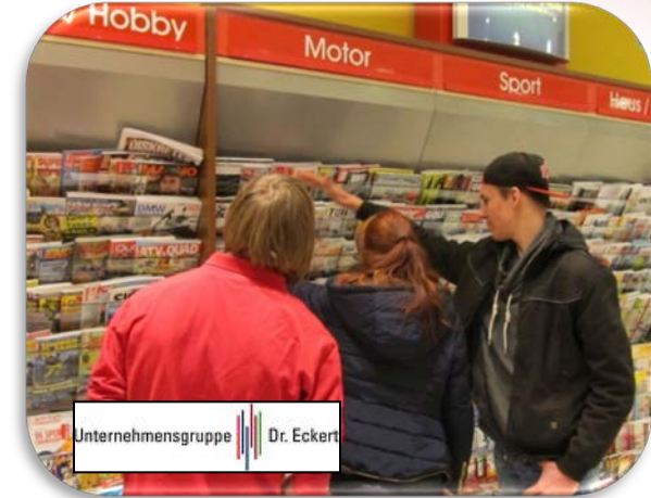
Infoveranstaltung mit der Unternehmensgruppe Dr. Eckert