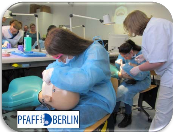
Polieren der Zähne an einem Phantomkopf im Pfaff-Institut