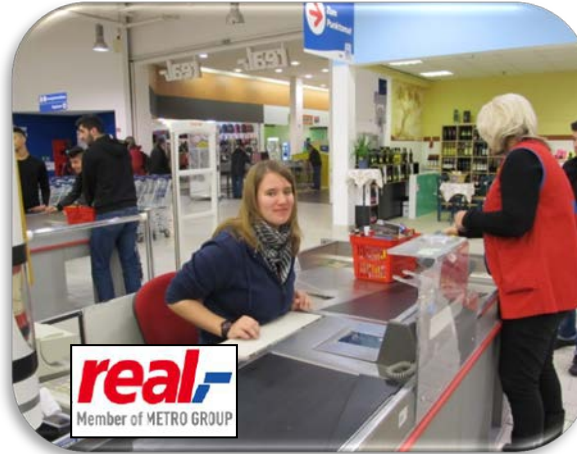
Infoveranstaltung in einem Real Markt