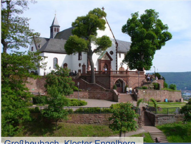
Großheubach, Kloster Engelberg