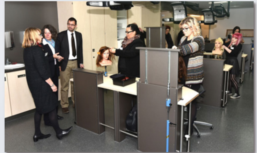
und neues Kompetenzzentrum